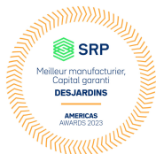
Meilleur manufacturier, capital garanti