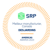
Meilleur manufacturier, Canada