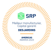
Meilleur manufacturier, capital garanti