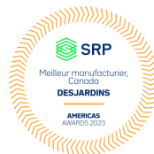
Meilleur manufacturier, Canada